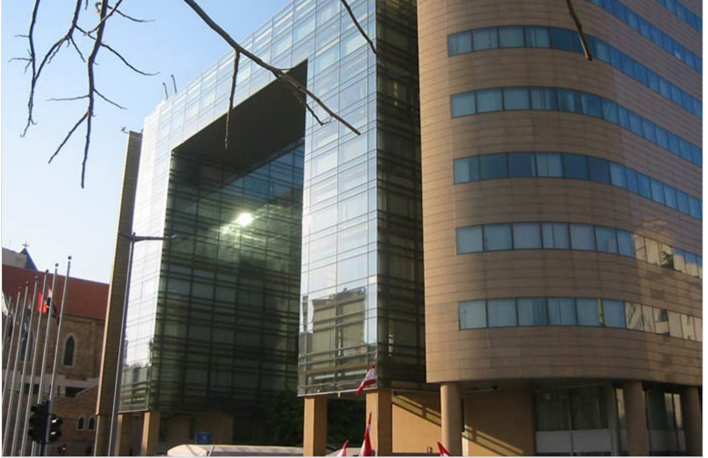
مقر الأمم المتحدة في بيروت