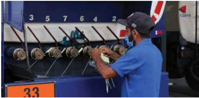
تدابير وقائية مشددة