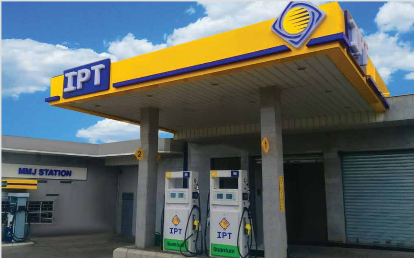
محطة م.م.ج. - شاوية المتن (المتن)