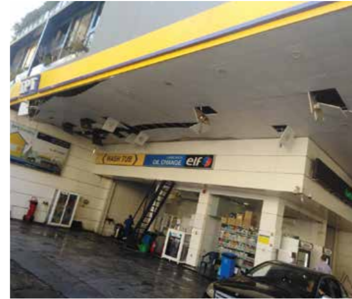
محطة سيوفى - الأشرفية