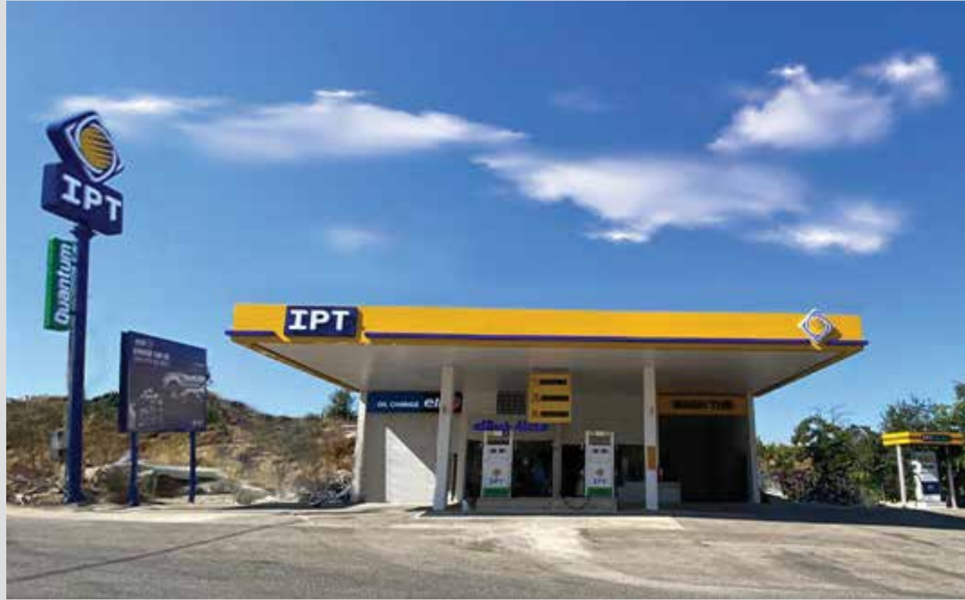
محطة خير الله - بحمدون (عاليه)

في الوقت عينه، وبإصرارٍ كبير، نوّكّد لكم أننا ماضين في استراتيجية التوسع في كافة الأراضي اللبنانية لكون دائماً الأقرب إليكم. تعرّف على المحطات التي انضمّت مؤخراً إلى شبكة أي بي تي في منطقتي الشاوية -المتن وبحمدون.