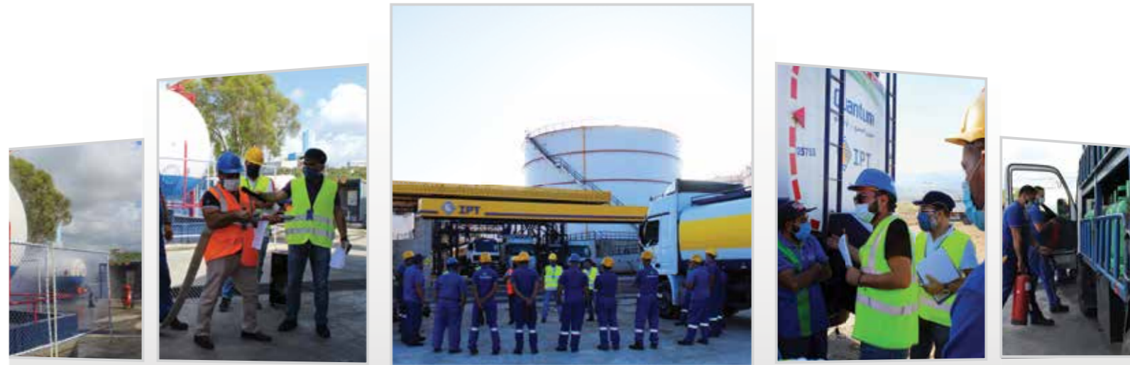
تدريبات متنوّعة حول "أسس السلامة العامة"، مكافحة الحرائق والإسعافات الأولية

إنّ إلتزام أي بي تي بتطوير مهارات موظفيها وحثّهم على المثابرة والنجاح لمواصلة التقدّم الذاتي والجماعي معاً يصبّ في تحقيق أهداف ورؤية الشركة. من هذا المنطلق، يحرص قسم الجودة والسلامة على حسن تطبيق ومراقبة برنامج التدريبات السنوي المدرج ضمن المهام الأساسية لجميع أقسام الشركة، وفقاً لمعايير الجودة والصحة والسلامة والبيئة المتبعة، وبهدف تأدية المهام باحترافية عالية تخدم الزبائن وأصحاب المصالح بشكل أفضل وتحافظ على السلامة العامة.