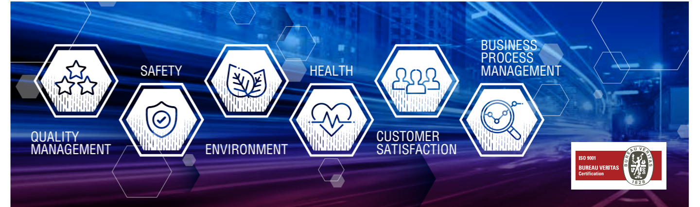
ركانز نظام الشركة في الجودة والصحة والسلامة والبيئة

خصّصت أي بي تي صفحات موقعها الإلكتروني لتشمل جميع الأنشطة والإهتمامات، فقد تميّزت صفحاتها الجديدة بمساحة خاصة لتسليط الضوء على السياسة والاستراتيجية التي صممتها الشركة QHSE Policy، طيلة مسيرتها المهنية، بهدف حماية صحة وسلامة جميع موظفيها وزبائنها، ولتقليل مخاطر تلف أو خسارة الأصول ولضمان حماية البيئة.