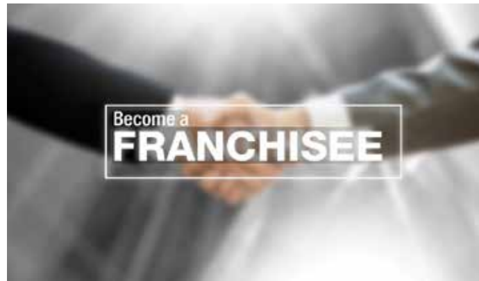
Join Our Network

إملاً إستمارة Join Our Network على موقعنا الإلكتروني iptgroup.com.lb ضمن صفحة: Become A Franchisee وسيقوم إختصاصيو قسم المحطات بالتواصل معك.