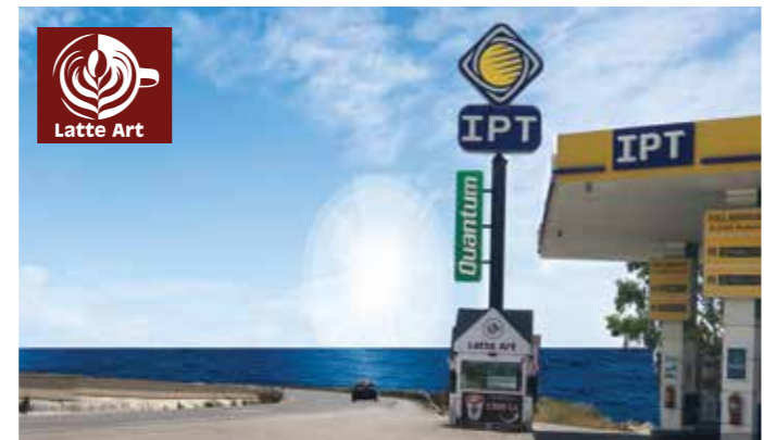
كيبسك Latte Art في محطة أي بي تي البربارة