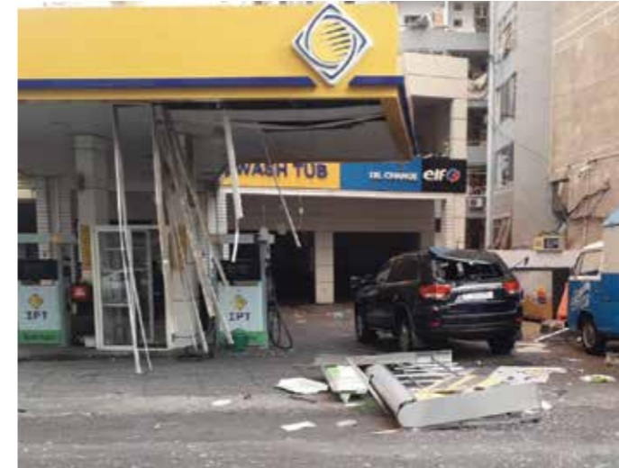
محطة الجعيتاوي - الأشرفية