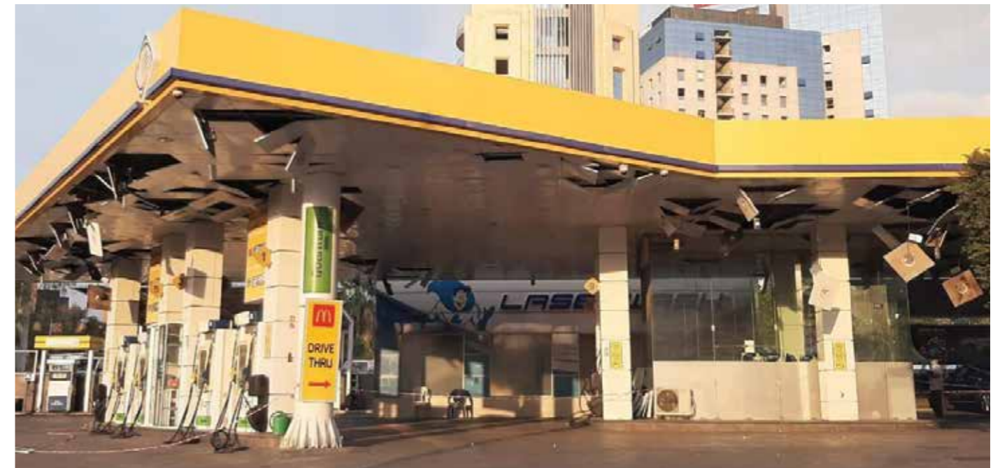
محطة الدكوانة - الدكوانة