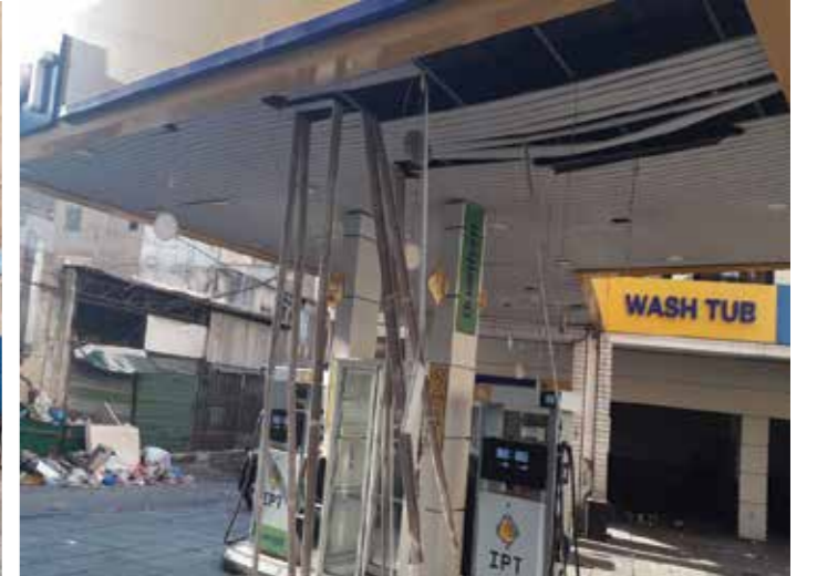
محطة الجعيتاوي - الأشرفية